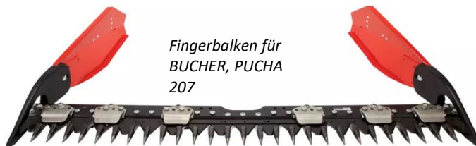
Fingerbalken für BUCHER, PUCHA 207