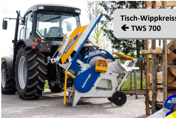
Tisch-Wippkreissäge ← TWS 700