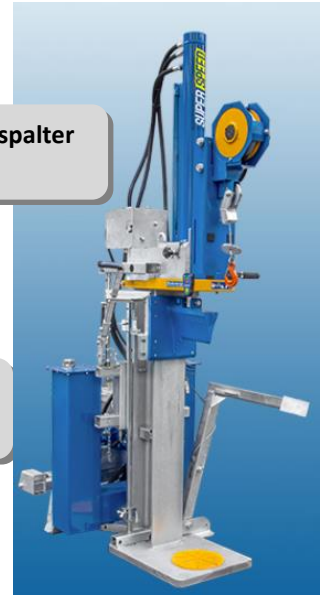
Meterspalter H20 Z →

Aufpreis für Hartmetall-Sägeblatt 700 mm Ø € 132,00