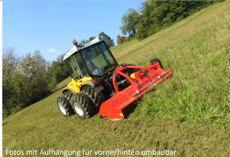
Fotos mit Aufhängung für vorne/hinten umbaubar