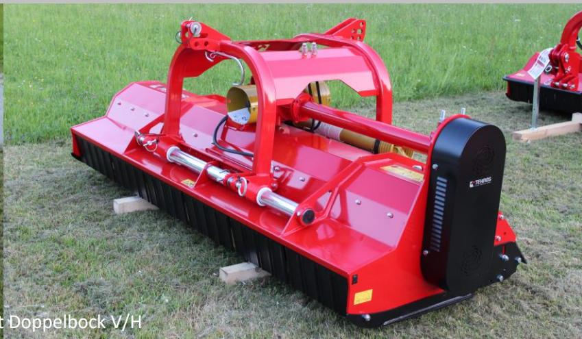
Fotos mit Doppelbock V/H